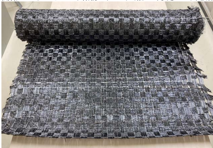
図3 開織コミングルヤーン平織物プリプレグシート

開織コミングルヤーン平織物プリプレグ(幅1m、長さ40m)、綾織物プリプレグ(幅1m、長さ30m)